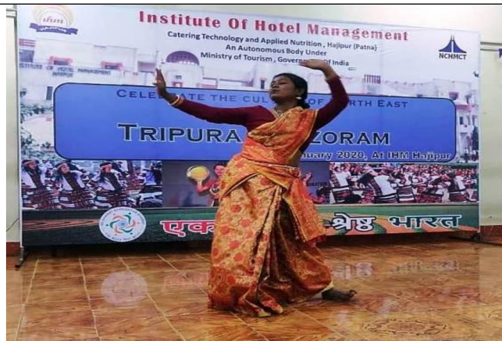
Cultural Programme on the theme of TRIPURA & MIZORAM under EBSB organised by IHM Hajipur on 17/01/2020