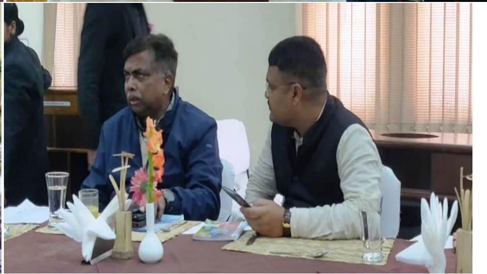
Participants & Media person Galery