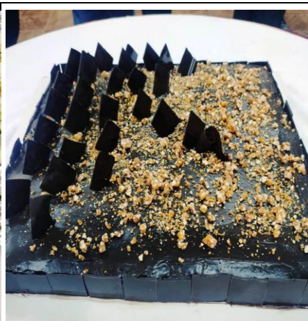
Dishes served during the Programme