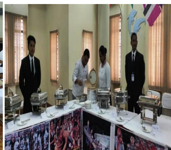
Decoration of Restaurant on the Theme of Tripura & Mizoram