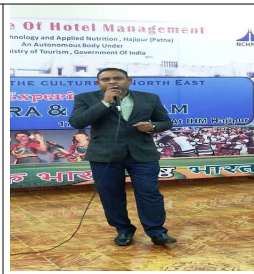
Faculty & student speed during the cultural programme